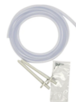
Set 2x pressure tip A-480 en 2m slang A-481