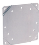
Achterplaat Magnehelic Alu A-368